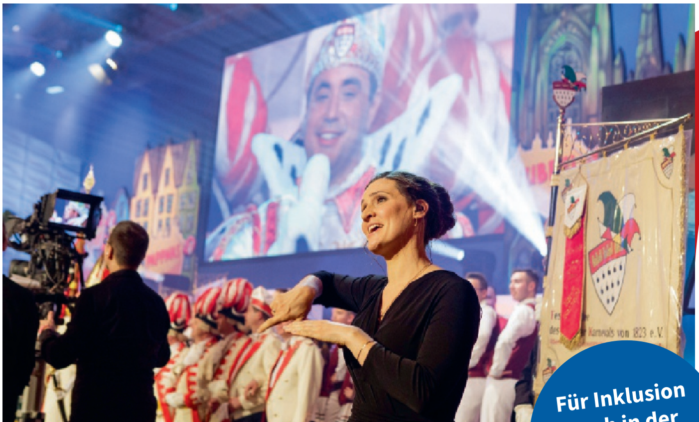
Gebärdensprachdolmetscherin im Kölner Karneval